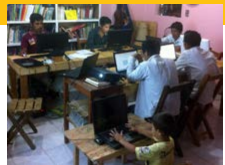
Promotores de educación en su capacitación en computación.