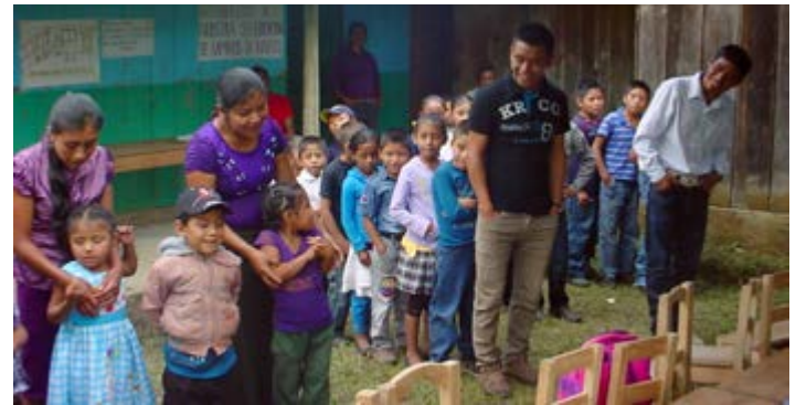
Niños de la comunidad de Montecristo Viejo con sus promotores en la celebración por el cambio de niveles.

Se realizó en medio de una fiesta muy alegre, con cantos, bailes, poesías y algunas exposiciones de sus conocimientos.