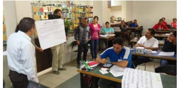
Jornadas de Buen Vivir con los maestros de secundaria y bachillerato de Uruapan, Michoacán. 16 de octubre de 2015.

Acompañamos y apoyamos esta iniciativa. Nos parece importante llevar esta reflexión a los procesos educativos maristas.