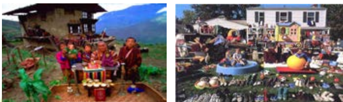
Fotos del libro "Mundo material" de Peter Menzel donde aparecen dos familias, de países con sistemas económicos distintos, con todas sus pertenencias (bienes de consumo).

Cada sistema económico, social y político adopta diferentes estilos para la satisfacción de las mismas necesidades humanas fundamentales. En cada sistema, éstas se satisfacen (o no) a través de la generación (o no generación) de diferentes tipos de satisfactores y bienes de consumo.