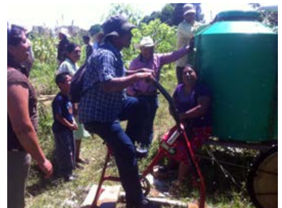
Los visitantes de Los Riegos probaron la bomba de mecate instalada en El Ranchín.