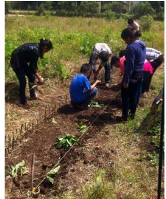
Alumnos de la secundaria sembrando barreras productoras de biomasa para material de composta.