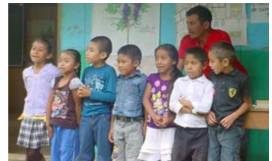
Cambio de niveles en Montecristo Viejo