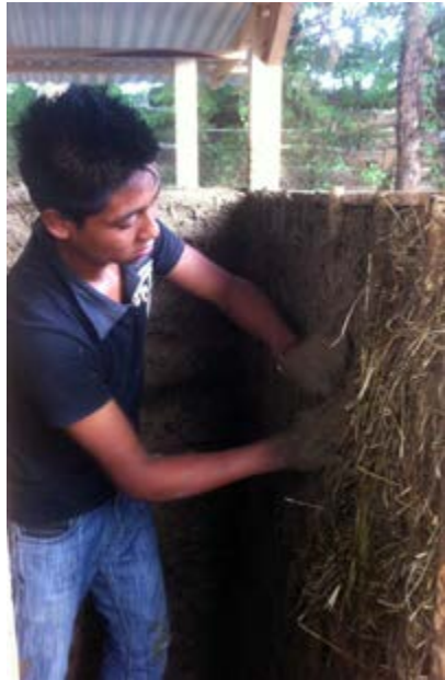
Relleno de tierra tipo bajareque en la letrina compostera de la Secundaria NEAPI

Del mismo modo estamos realizando diversos experimentos en las clases de Física, Química y Biología relacionados con situaciones que estamos viviendo en nuestras comunidades: cálculo de densidades, sustancias que rompen la tensión superficial, observación de las flores del maíz y del frijol, elaboración de pluviómetros, etc.