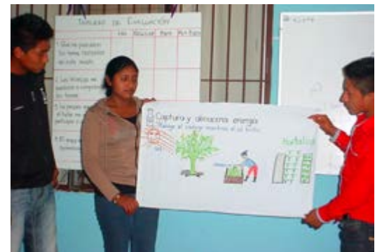
Exposición final de la semana con tema del principio 2 Permacultura: captura y almacena energía.

“La identidad está relacionada con el vivir bien, la armonía o el equilibrio está relacionado con el vivir bien, la complementariedad está relacionada con el vivir bien, el consenso está relacionado con el vivir bien...”