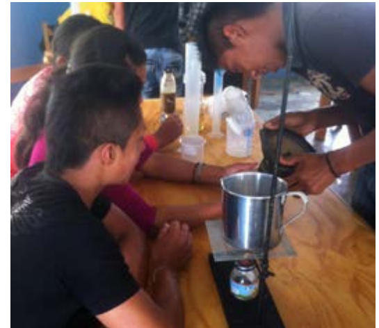
Métodos de separación de mezclas en el laboratorio de Química

El primero que tratamos fue: “Valorar nuestra identidad campesina” , en el cual partimos de un análisis de las necesidades y cómo son cubiertas en la comunidad; qué de satisfactores y bienes de consumo se utilizan y qué efecto tienen sobre nuestras vidas. Nos pareció importante iniciar con este tema por la realidad que viven hoy nuestros jóvenes dentro de la sociedad de consumo y la relevancia del mismo dentro de nuestra Educación para el Buen Vivir.