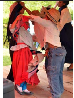
Bailable en el festival de NEAPI.

Este evento reúne un número aproximado de 300 personas, que convivimos durante 2 días en una fiesta de comunión entre todos los que formamos parte de esta propuesta educativa. Este año una de las intenciones más sentidas es el festejo de los 20 años de este caminar educativo que conmemoramos en este evento, agradeciendo a todos los presentes y no presentes que contribuyeron en la construcción de este proceso que actualmente nombramos como NEAPI.