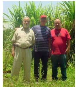
Visita de los hermanos maristas a la Secundaria NEAPI.