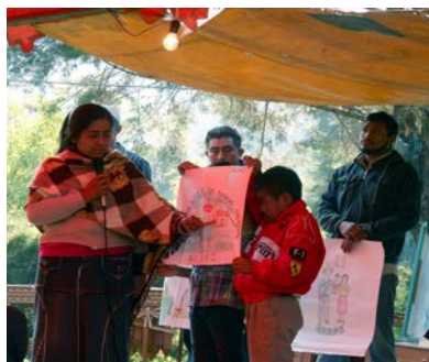
Presentación de una propuesta para el logotipo de NEAPI

Con este fin se convocó a las comunidades a que presentaran propuestas de dibujos para elegir el logotipo. En el festival se hizo la presentación y explicación de las ideas propuestas.