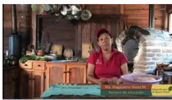
Escena del video: Educación para el Buen Vivir.