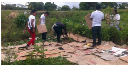
Jóvenes de Oaxaca cubriendo con cartón una zona donde se implementará una propuesta de Bosque Comestible.

El día 25 de junio, nos visitaron estudiantes de la “Escuela San José, el Paraíso”, extensión del Bachillerato Marista de Oaxaca, un grupo de 22 jóvenes y 3 maestros, que nos acompañaron toda la mañana en las instalaciones de nuestro: Centro demostrativo de Buen Vivir “El Ranchín” en Las Margaritas, Chiapas. Observaron las diferentes propuestas que realizamos para el cuidado de la madre naturaleza y colaboraron en el trabajo que realizamos para establecer la muestra de un “Bosque – cafetal comestible”, fortaleciendo así los lazos solidarios entre las obras maristas.