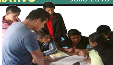
Alumnos de la Secundaria Neapi trabajando en equipo.

El pasado mes de junio terminamos la primera etapa de estudio en las comunidades llamado "Secundaria NEAPI", con un total de 25 jóvenes, que trabajaron con dedicación y esfuerzo durante un año. En el festival de clausura, los alumnos expresaron varios de los conocimientos adquiridos. Resaltaron la importancia de su capacitación y lo significativo del proceso para ellos y para sus comunidades, así como su deseo de continuar en la siguiente etapa.